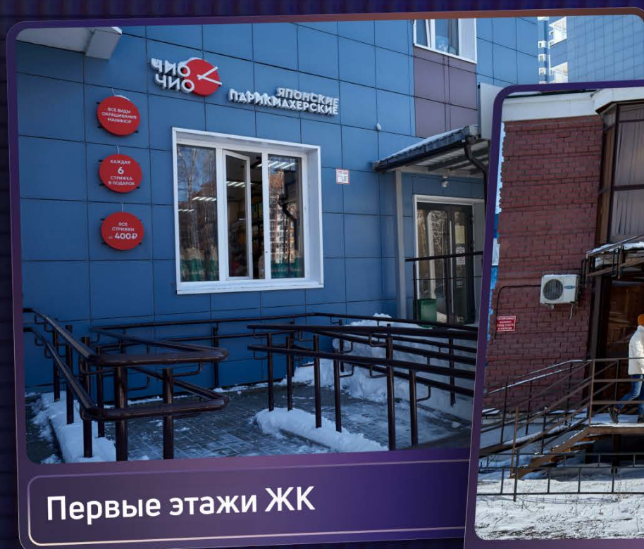
Первые этажи ЖК